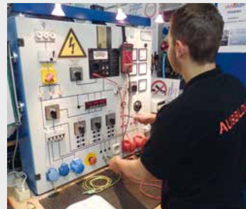
„Ich montiere Systeme und Anlagen und stelle sicher, dass sie zuverlässig funktionieren.“

Als Elektroniker/in Betriebstechnik montierst du Systeme und Anlagen, nimmst sie in Betrieb, hältst sie instand und betreibst sie. Deine Gebiete sind die Energieversorgungstechnik, die Mess-, Steuer- und Regelungstechnik sowie die Kommunikations-, Melde-, Antriebs- und Beleuchtungstechnik.